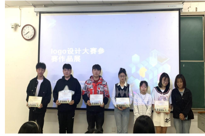
▲参赛选手及其作品

此次“厚溥杯”商业网页设计大赛不仅培养了理工学部同学们学习计算机的兴趣，还提高了学生们审美能力。相信经过此次比赛，理工学部同学们的网页制作水平会得到更大的提升。